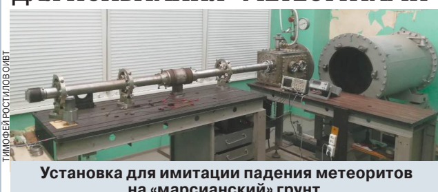
Установка для имитации падения метеоритов на «марсианский» грунт.

Эксперимент по моделированию марсианского грунта и испытанию его на деформацию и распространение ударной волны от падения «метеоритов» провели в Москве специалисты Института геохимии и аналитической химии В. И. Вернадского РАН (ГЕОХИ). Объединенного института высоких температур РАН (ИВТ) и Института космических исследований РАН.