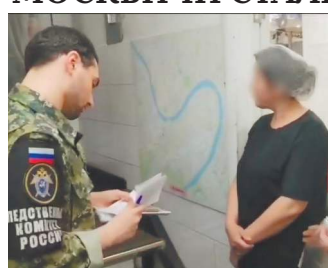
В пищевом цеху трудилась мигранты.

По-быстрому утилизируют продукты попыталась работница пищевой предприятия, которые изготовили некачественные салаты, уложившие в выходные москвичей на больничные койки. У некоторых пострадавших заподозрили ботулизм. Как стало известно «МК», в столичные больницы обратились 10 человек в возрасте от 18 до 60 лет с признаками пищевого отравления. Все они рассказали одну историю. Москвичи заказывали холодные блюда через разные службы доставки. Недомогание они почувствовали спустя несколько часов после употребления салатов двух видов. По данным столичного управления