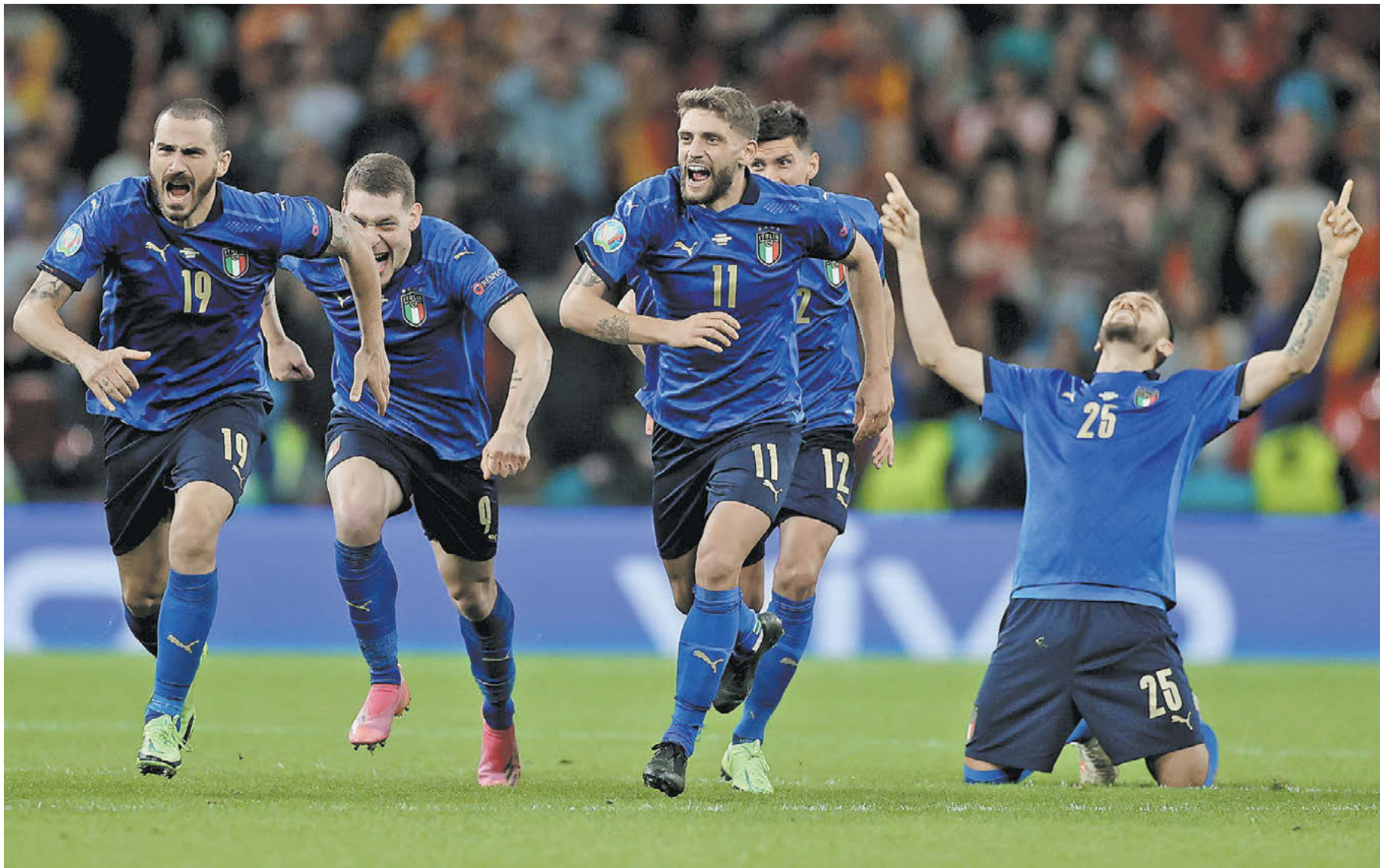
Вчера. Лондон. Италия – Испания – 1:1 (пен. – 4:2). Счастье «Скуадры адзурры»

«Скуадра адзурра» и «Красная фурия» устроили великолепный спектакль на «Уэмбли», в котором удачливее оказалась команда Роберто Манчини