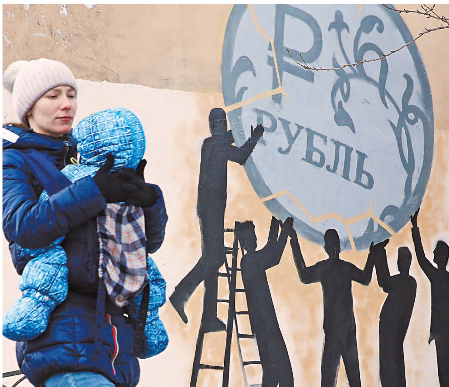
С повышением МРОТ вырастут пособия по уходу за ребенком для матерей, не имеющих стажа. Это поможет снизить семейный бюджет.