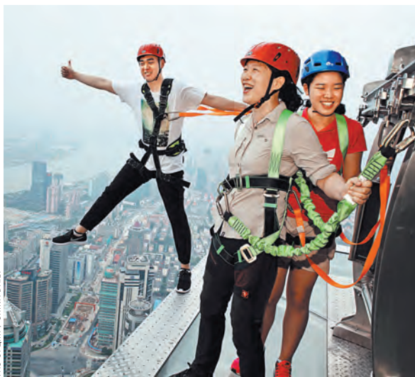
Это захватывающий, но безопасный способ взглянуть на город с высоты.

Пешеходная дорожка на небоскребе стала самым высоким аттракционом без ограждения на открытом воздухе