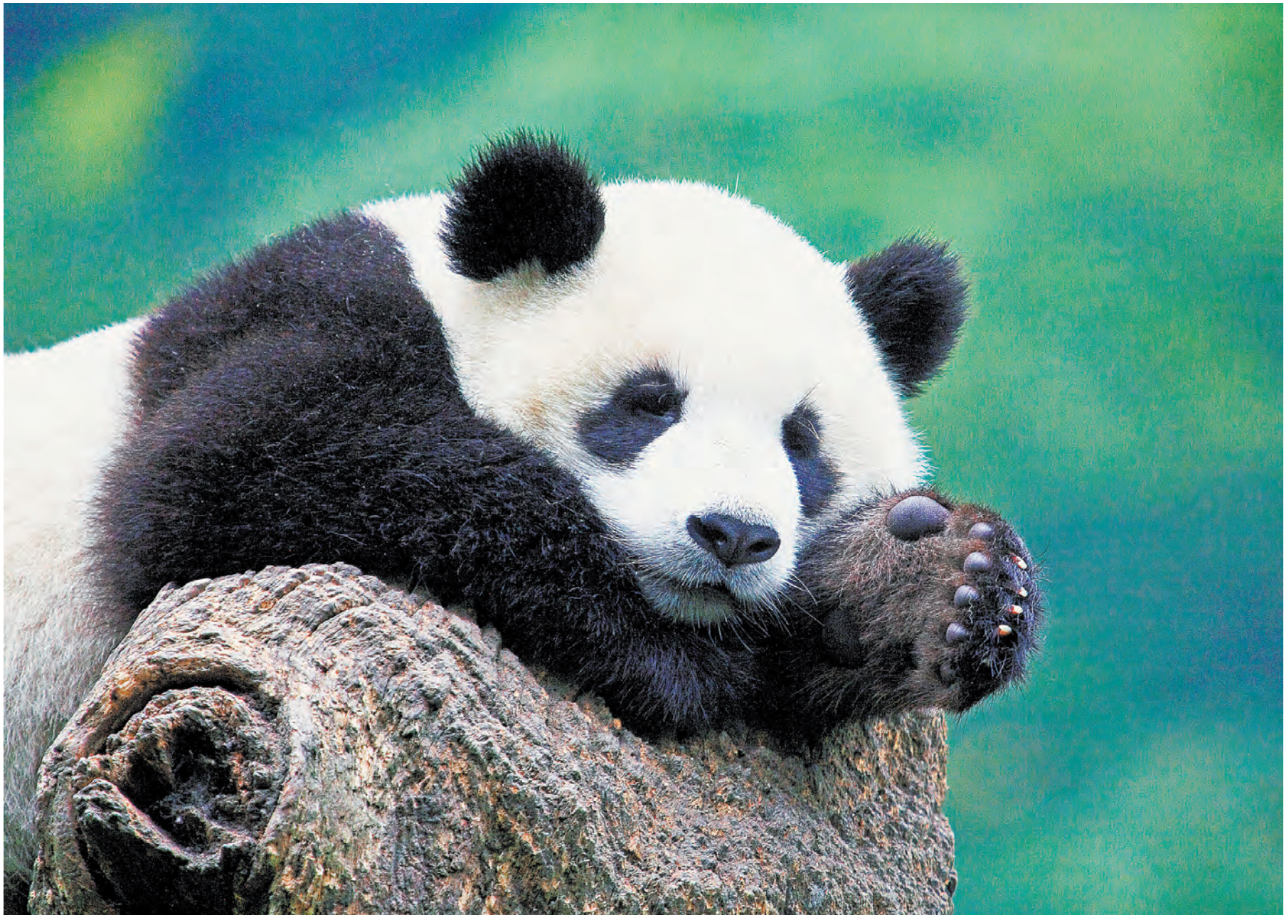
UDF X CHINA DAILY