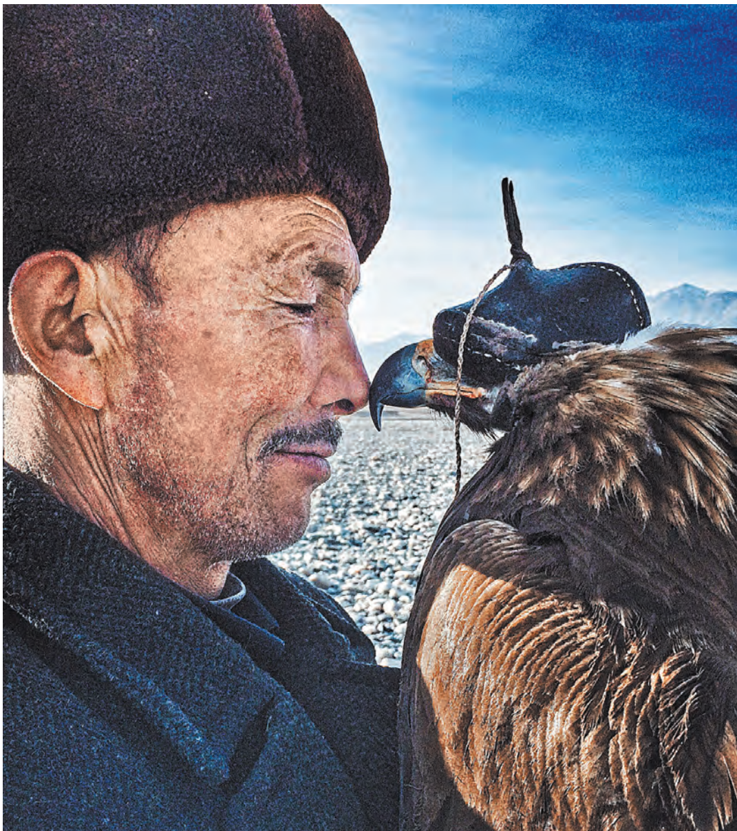
Суровый 61-летний мужчина, который почти не улыбается, вдруг стал таким нежным со своим орлом.