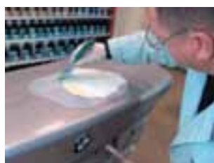
Эффективное шпатлевание – выбор за Вами

тел: (495) 741-59-81 факс: (495) 741-59-82 E-mail: kuzov-auto@yandex.ru