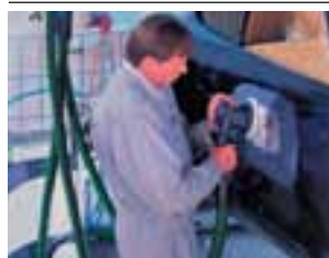
WTS 150/7 – специалист по большим поверхностям