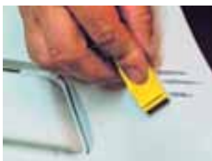
Пространство и время. Секреты локальных экспресс-ремонтов