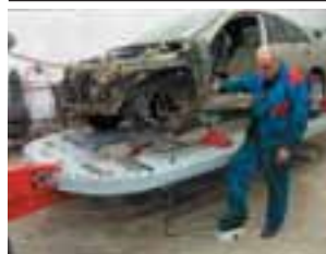
Добро пожаловать на стпель