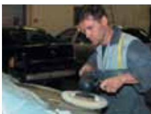
Продолжая тему полирования