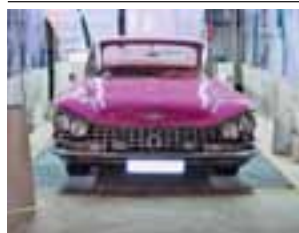
MITRA – российское производство, европейское качество