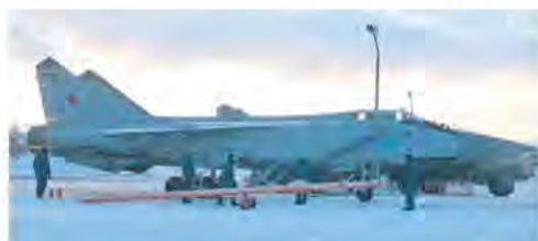
Подготовка к вылету.

Вот уж точно: для них первым делом - самолёты. И именно поэтому мне оказалось так непросто договориться о встрече с командованием отдельного смешанного авиаполка армии ВВС и ПВО Северного флота, чтобы подготовить материал ко Дню авиации противовоздушной обороны. К счастью, после нескольких дней переговоров в плотном графике ратных дел лётчики-истребители всё же смогли выкроить немного времени, чтобы рассказать о профессии.