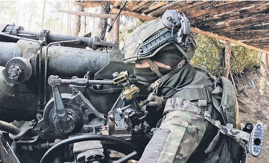
СЕРИИ ФАЙЛЫ ИЗ ВИДЕО МИНОБОРОНЫ РОССИИ

Задачи специальной военной операции наши воины выполняют, демонстрируя подлинное бесстрашие, истинную отвагу, высокое ратное мастерство и негибаемую стойкость