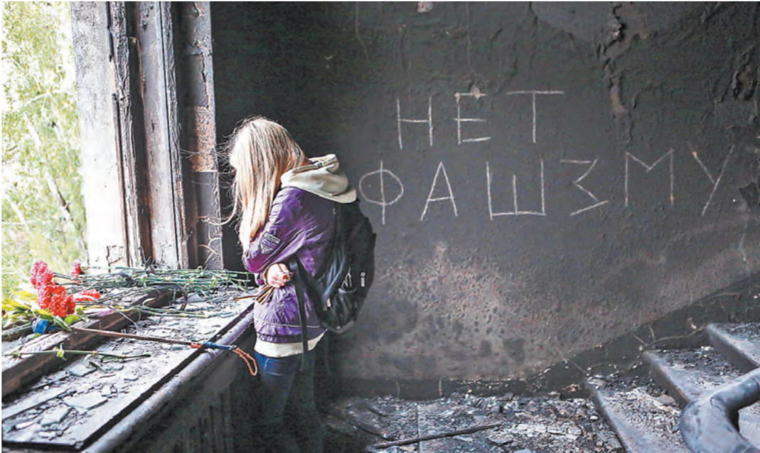
Забывать о пролитой крови не дают одесситы: в этот день снова придут к Дому профсоюзов.

Петр Лихоманов Страшная дата — 2 мая 2014 года, день, когда «победители майдана» совершили массовое убийство одесситов, с каждым годом, прошедшим после похорон жертв, не теряет своего скорбного смысла и значения. И чем сильнее о ней стараются забыть организаторы преступления, тем более очевидной становится вина. Забывать о пролитой «по воле майдана» крови не дают одесситы, которые в этот день снова придут к Дому Профсоюзов, чтобы скорбная дата не слыхалась с безликими «майскими выходными», не превратилась в рутину, как того наверняка хочется кому-то очень испуганному в Киеве. Как пройдет 2 мая в Одессе в этот год — манеру поведения