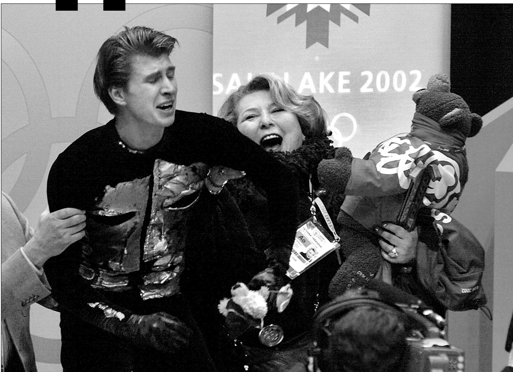
Вчера. Солт-Лейк-Сити. Delta Ice Center. Мгновение назад Татьяна ТАРАСОВА и ее ученик Алексей ЯГУДИН увидели невероятные оценки, которые он получил за артистизм. Чемпионские!