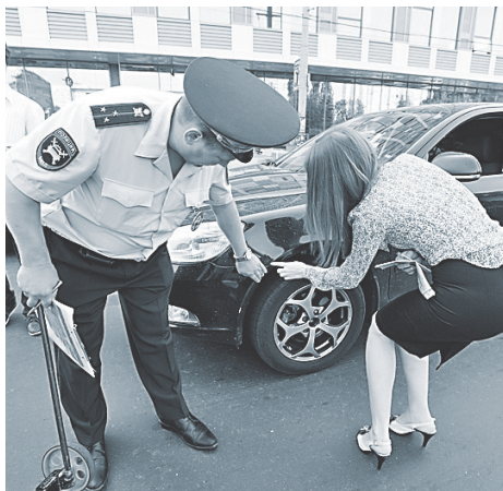
Если на ДТП вызвать полицию, выплата за ущерб будет больше.