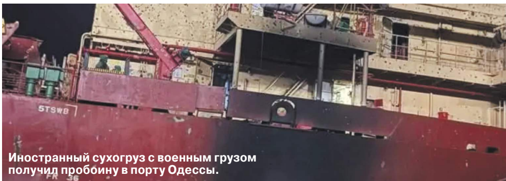
Иностранный сухогруз с военным грузом получил пробитину в порту Одессы.