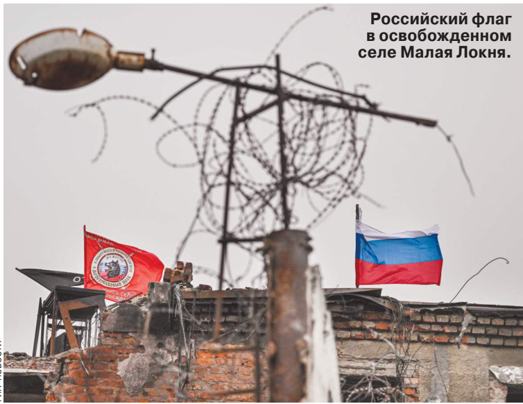
Российский флаг в освобожденном селе Малая Локня.