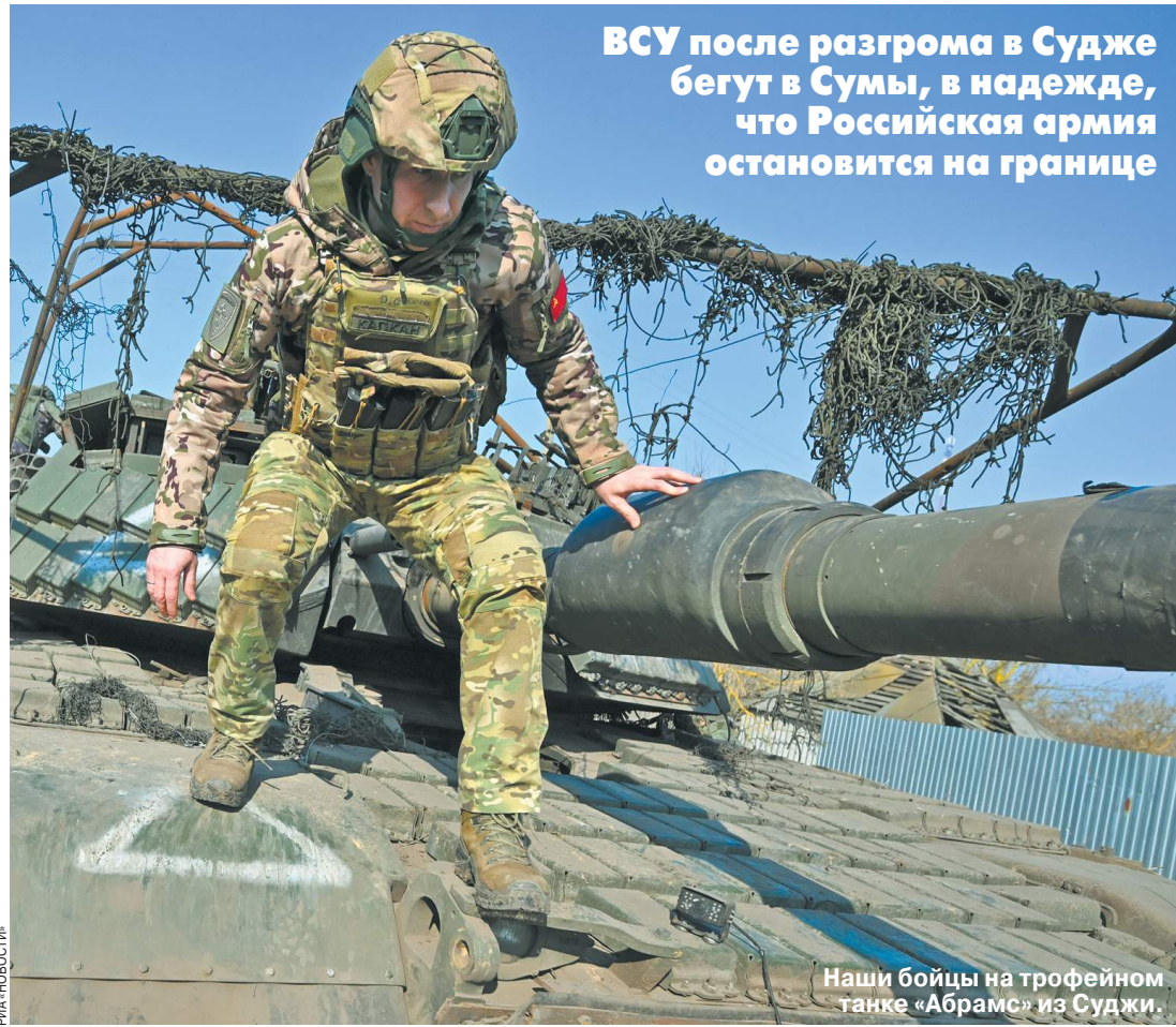
ВСУ после разгрома в Судже бегут в Сумы, в надежде, что Российская армия остановится на границе