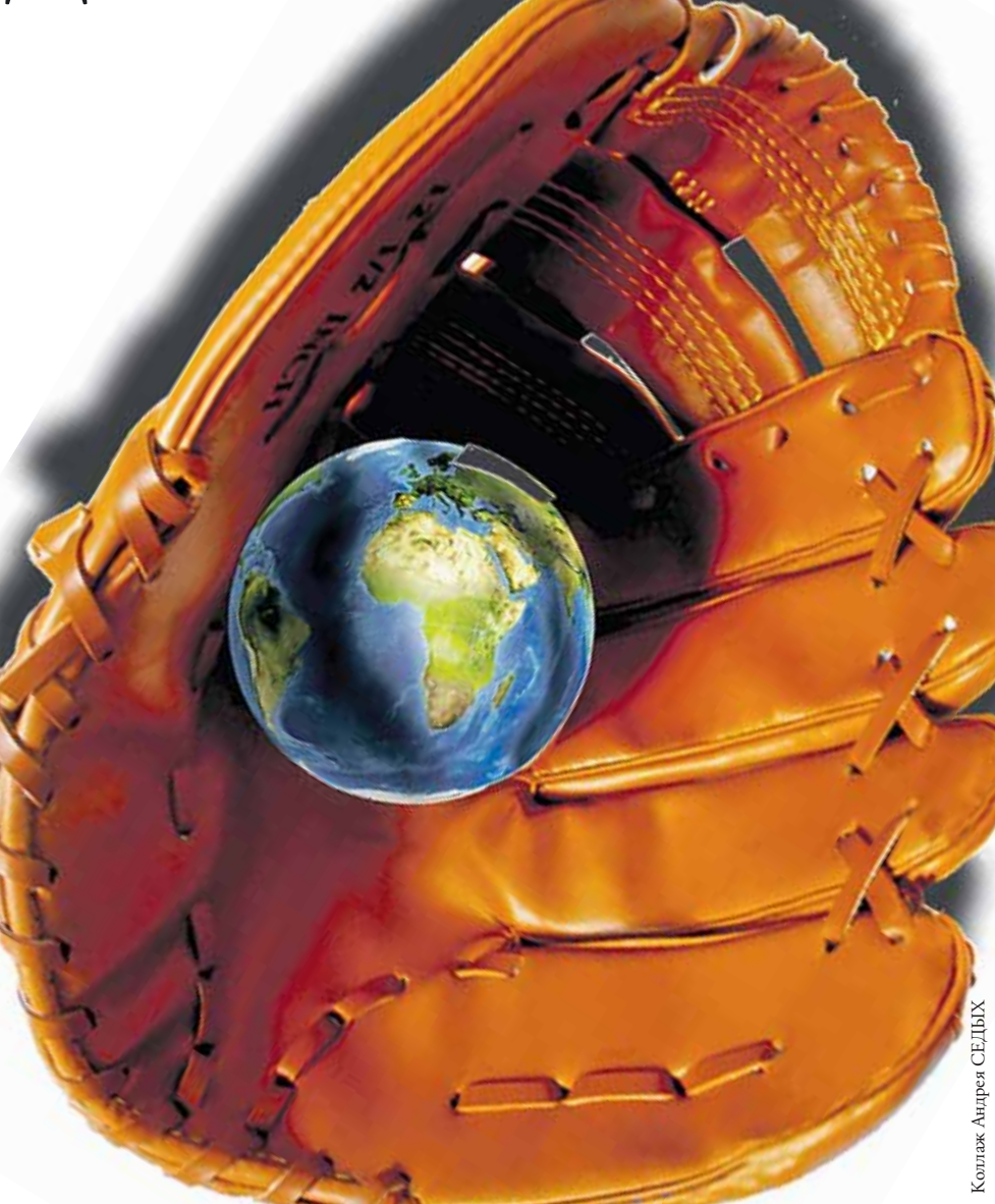
Коллаж Андрея СЕДУХА

Точечные бомбардировки позиций исламистов американской авиацией, как и попытки доставить воздушным путем беженцам гуманитарную помощь, подчеркивают неспособность администрации Барака Обамы поддержать Ирак, который является союзником Соединенных Штатов. Что опять-таки резко контрастирует с позицией России, которая поставила Багдаду современные системы ВВТ в условиях, когда иракское правитель-