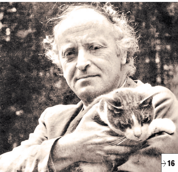
Сегодня, в день рождения Иосифа Бродского, наш корреспондент путешествует по любимым местам поэта в Риме.

Только в «РГ» Президент Чехии Милош Земан — о санкциях, миграции и будущем Старого Света