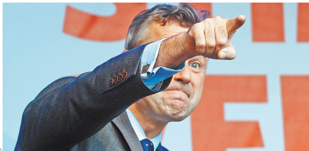
Радикальный националист Норберт Хофер пообещал изгнать Австрию от мигрантов, когда станет президентом.

Националист из Партии свободы Норберт Хофер проиграл президентские выборы в Австрии. Для победы ему не хватило менее процента голосов. Его противник, бывший лидер «зеленых» Александр Ван дер Беллен становится президентом. Но все же главный итог состоявшегося волеизъявления в другом: впервые после Второй мировой войны ультраправый националист, который публично придерживался радикальных взглядов по отношению к политике ЕС и миграционному законодательству, находился в шаге от того, чтобы возглавить Австрию.