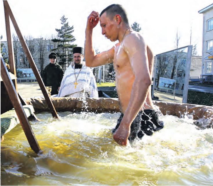
Крещенские купания прошли во многих подразделениях Южного военного округа. В части, расположенной в поселке Молькино под кубанским городом Горячий Ключ, прямо на плацу возвели импровизированную иордань объемом пять тысяч литров. Первыми окунулись в нее будущие спецназовцы – военнослужащие срочной службы осеннего призыва. Всего за день искупались более 100 солдат.