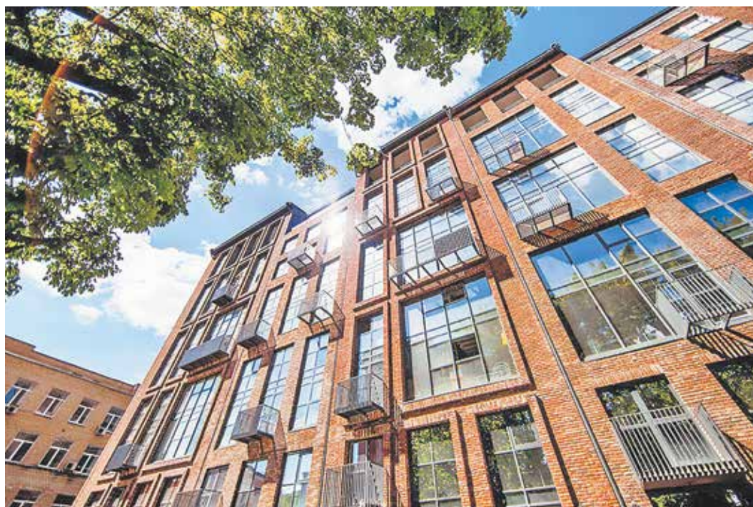
Строительство зданий с апартаментами позволяет обходить требования, предъявляемые к жилью, в частности, не возводить объекты социнфраструктуры