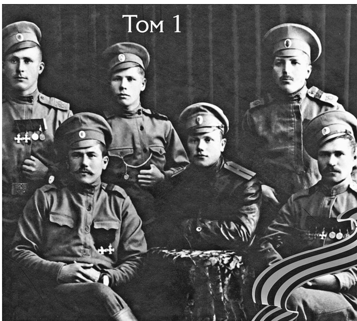
«Россия в Первой мировой войне 1914–1918» — весомый (энциклопедия весит почти восемь кг) вклад в осмысление времени, которое перевернуло мир.