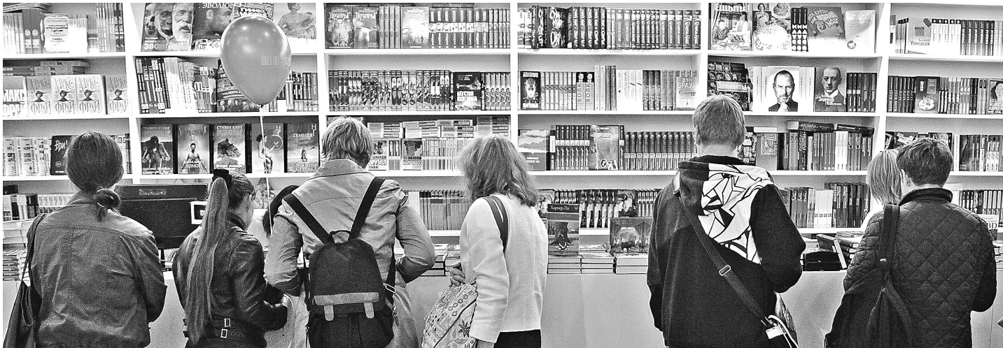
Выставка в этом году стала компактной, но все же вместила стенды 63 стран.