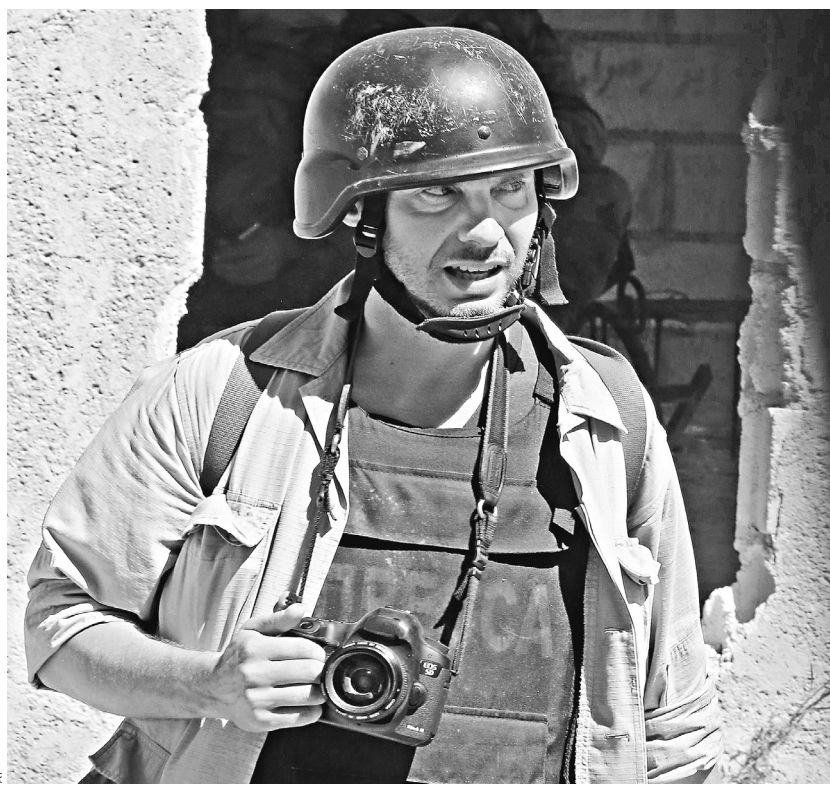
Следственный комитет намерен найти тех, кто убил Андрея Стенина.