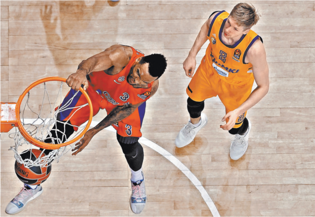
В рамках Евролиги ЦСКА пока ни разу не проиграл «Химкам» на домашней площадке.

18 октября, пятница, «Матч ТВ» 21.25. «Олимпиакос» (Греция) — «Зенит» (Санкт-Петербург). Прямая трансляция.