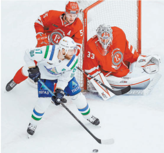
Игроки «Витязя» (в красной форме) уступили «Салавату» 1:2.

В двух других матчах хабаровский «Амур» со счетом 2:1 переиграл так и нашедшего пока главного тренера «Локомотив» из Ярославля, а китайский «Куньлунь» на своей площадке уступил череповецкой «Северстали». Здесь тоже счет 2:1, но игра завершилась в овертайме, «Куньлунь» набрал одно очко. ●