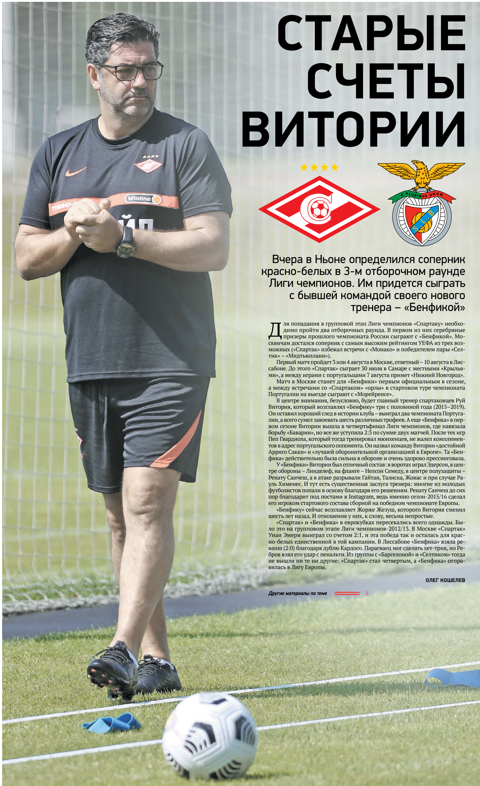
Главный тренер «Спартак» Руй Витория