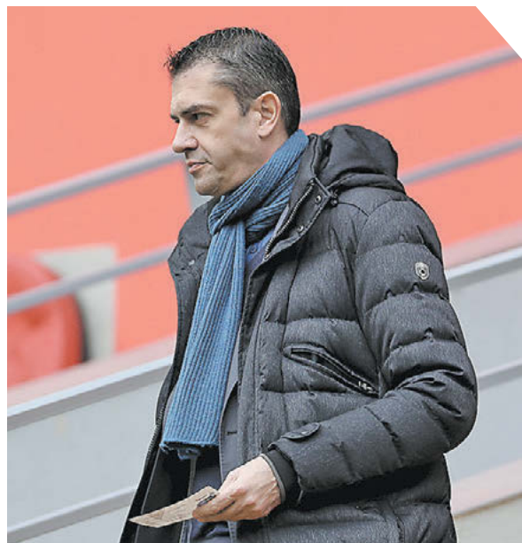
Александр Федоров «СЗ» / Canon EOS-1DX Mark II