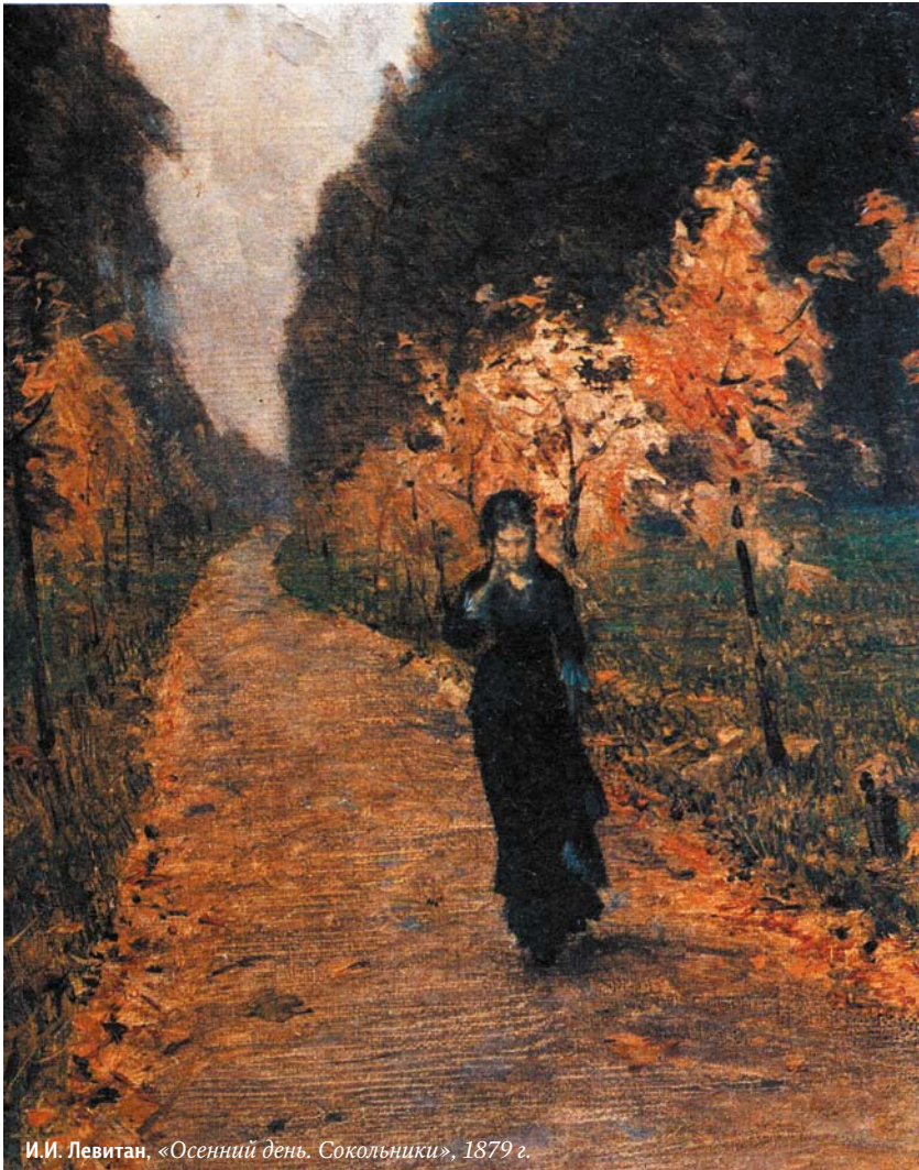
И.И. Левитан, «Осенний день. Сокольники», 1879 г.