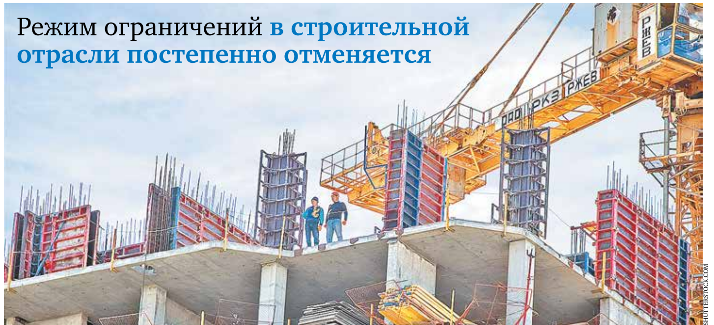
С 12 мая в Москве возобновились все строительные работы, кроме текущего и капитального ремонта в жилых домах

Режим ограничений в строительной отрасли постепенно отменяется