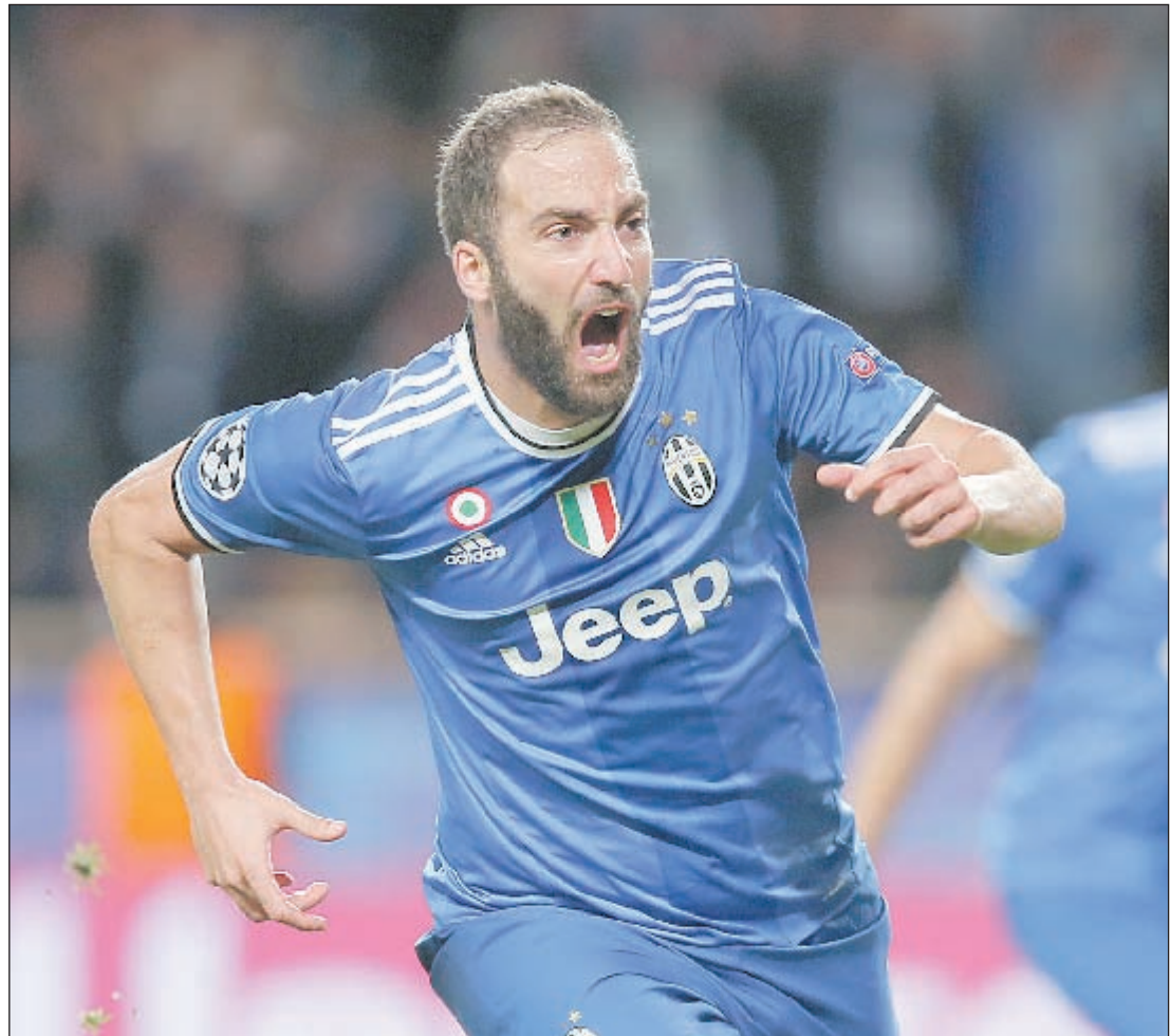
Вчера. Монако. «Монако» - «Ювентус» - 0:2. 29-я минута. Нападающий гостей Гонсало ИГУАИН празднует свой первый гол.

Дубль аргентинского форварда позволил «Ювентусу» сделать огромный шаг к финалу Лиги чемпионов