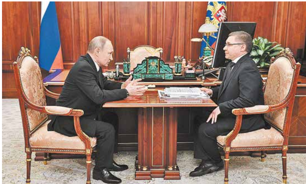
Президент России Владимир Путин и глава Минстроя Владимир Якушев

Реформа не стала помехой развитию стройкомплекса