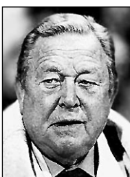
Президент УЕФА Леннарт ЮХАНССОН стал исполнителем решений суперклубов.

Итак, с сезона-1999/2000 Россия получает в расширенной Лиге чемпионов два места - наряду со «Спартаком» в главном клубном европейском турнире выступит и ЦСКА. Однако УЕФА решил взять за основу не новую, с учетом результатов нынешнего сезона, таблицу коэффициентов, а прежнюю, составленную в конце весны. Поэтому чемпион России начнет борьбу не с группового турнира, как ожидалось, а с третьего квалификационного раунда. «Подвинули» и нашего вице-чемпиона: ЦСКА на пути к Лиге нужно будет преодолеть не один, а два квалификационных барьера, причем, оступившись на первом, армейцы потеряют и право выступить в Кубке УЕФА.