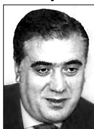
Президент «Реала» Лоренсо САНС был одним из вдохновителей революции в европейском футболе.

Заодно фактически сократилось представительство России и в этом, втором по значимости, европейском турнире, поглотившем Кубок кубков. При прежней системе у нашей страны были два места в старом Кубке УЕФА плюс одно в Кубке кубков - теперь осталось два (при слабой, как показывает практика, надежде увеличить свое представительство за счет пока сохраненного Кубка Интертото). Таковы плоды революции в европейском футболе, как уже успели окрестить решения исполкома УЕФА, принятые в Лозанне в конце прошлой недели. Той самой революции, о необходимости которой очень давно говорили самые богатые команды Старого Света - испанские, итальянские, английские. Не случайно еще с начала осени с подачи таких людей, как президент «Реала» Лоренсо Санс, президент «Интера» Массимо Моратти и другие, начал широко рекламироваться проект независимой от УЕФА Суперлиги, доступной только для избранных. Теперь ясно: это был плохо прикрытый шантаж, выдержав который Европейский союз не смог, да и не очень-то хотел. После череды согласований - опять-таки в основном с суперклубами, - и появилась на свет новая система проведения еврокубков. Она представляет собой, по сути, гибрид отвергнутой Суперлиги и остатков прежнего формата еврокубков, где действительно существовали спортивные принципы отбора и равноправия. Сейчас оно в УЕФА чисто декларативное - как в знаменитой книге, где на скотном дворе равны все животные, но одни равны в большей степени, чем другие.