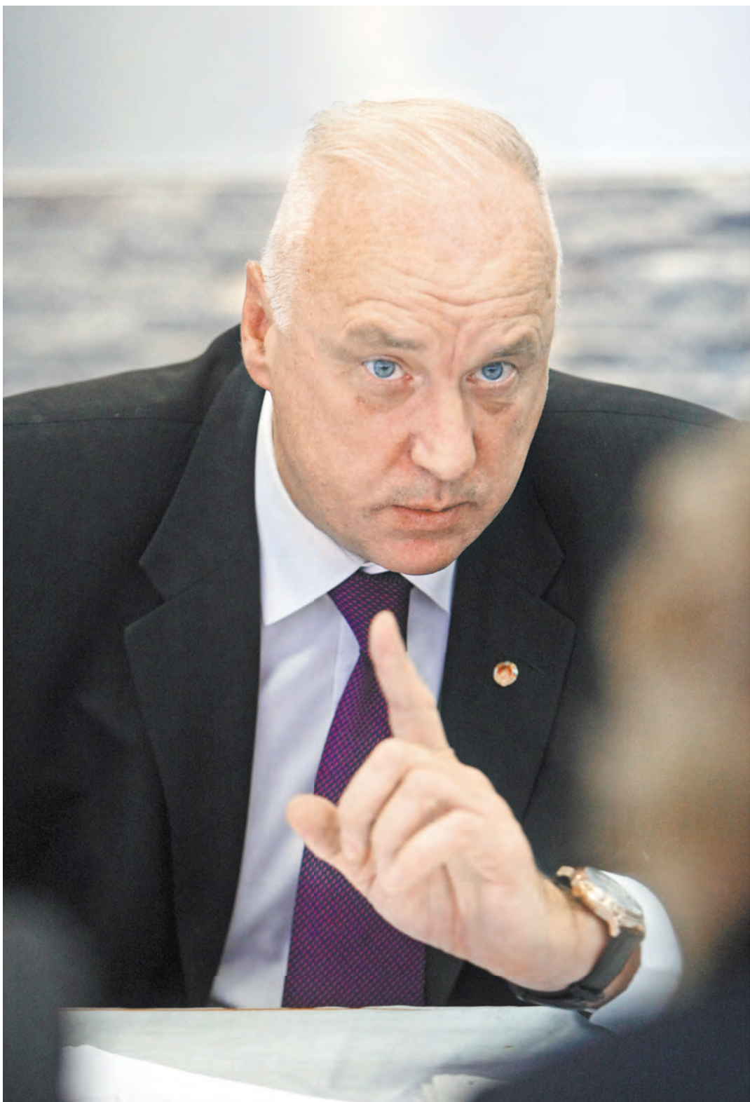
Александр Бастрыкин: Мы уже допросили в качестве свидетелей 113 тысяч человек.

АЛЕКСАНДР БАСТРЫКИН: СКР расследует совершенные за пределами территории России деяния, отнесенные нашим уголовным законом к преступлениям против мира и безопасности человечества.