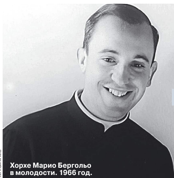
Хорхе Марио Бергольо в молодости. 1966 год.