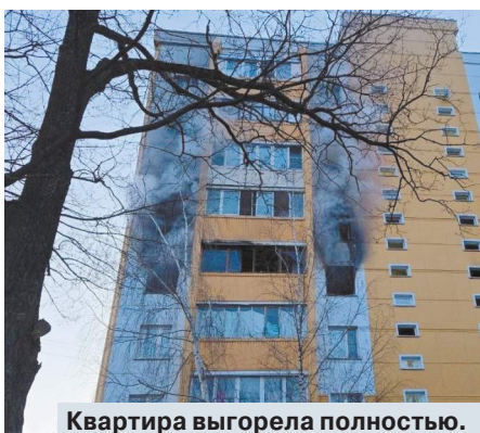
Квартира выгорела полностью.

К сожалению, спасти погорельцев не удалось — все четверо скончались.