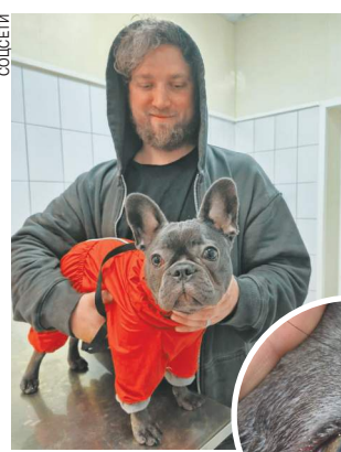
Трофей побежденного в поединке соперника две недели гордо пронесла в глазу собака по имени Бургундия. Из неравной схватки с домашним котом французская бульдожка вышла

При тщательном осмотре доктор обнаружил и извлекла из конъюнктивы песика странного инородного предмета. Им оказался кошачий коготь. Владычицы вспомнили хронологию событий: 6-месячная собака 2 недели назад встретилась на улице с котом. Произойти небольшая потасовка, кошка ретировалась, поджав хвост, и про эту историю владелицы Бургундии быстро забыли. А тем временем коготь, оставленный в глазу собаке, едва не привел к печальным последствиям — полной слепоте. После извлечения инородного предмета собаке было назначено профилактическое лечение.