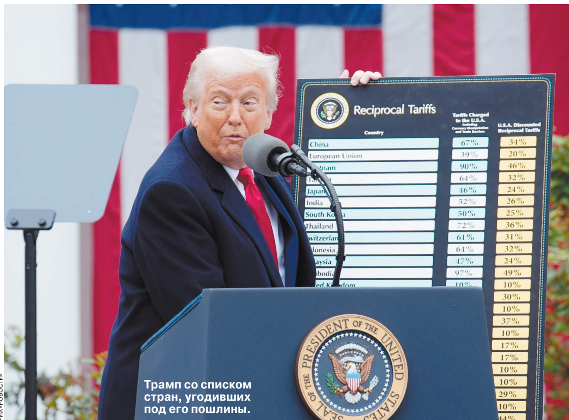
Трам со списком стран, угодивших под его пошлины.