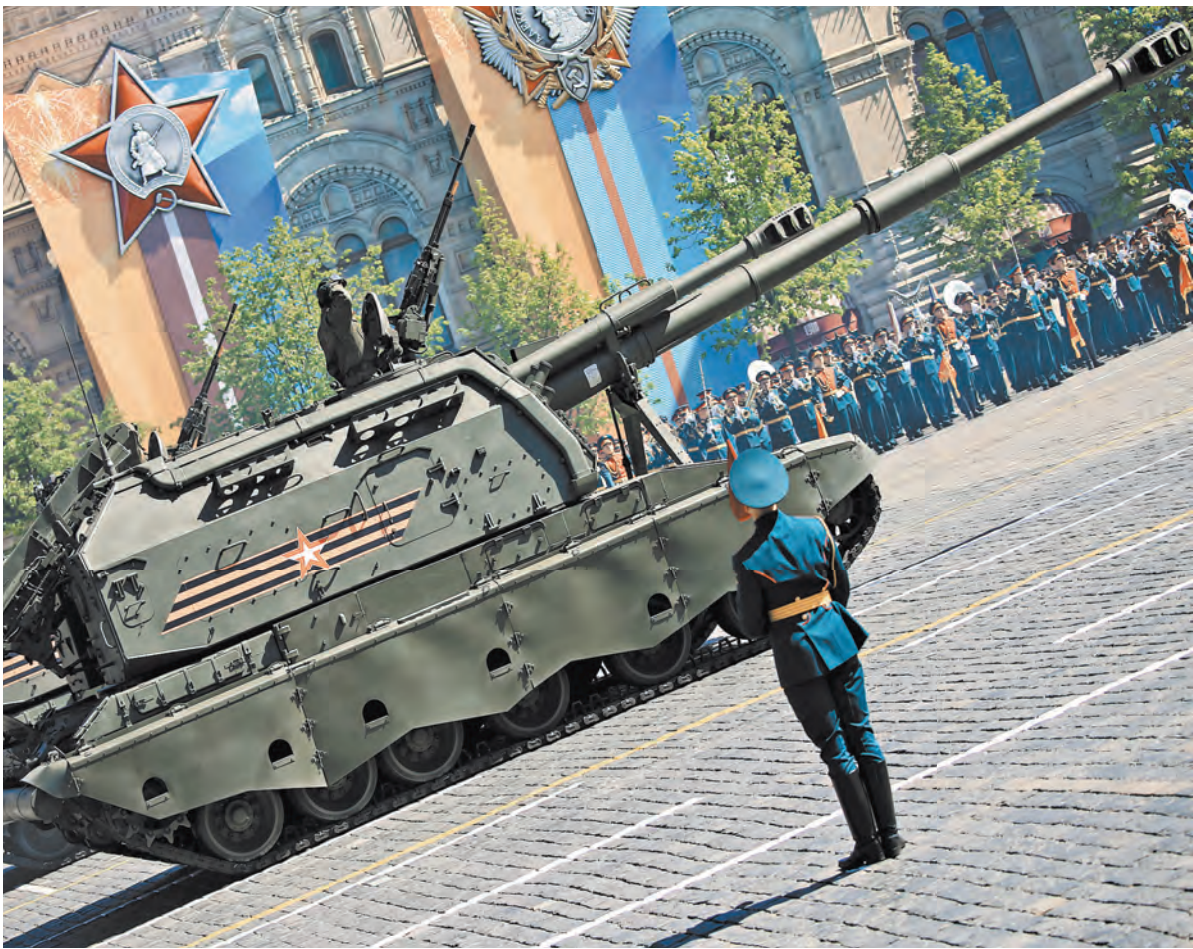
По Красной площади прошли образцы современной боевой техники.