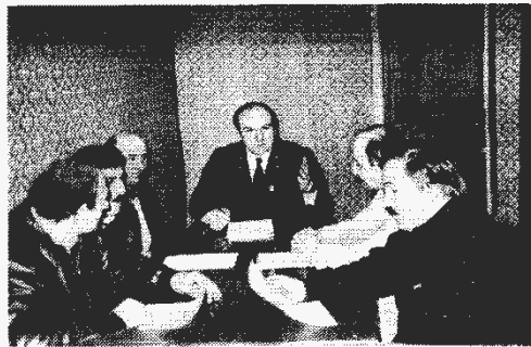
На Ахалдабской мебельной фабрике

В тесном контакте с природоохранительными, различными контролирующими