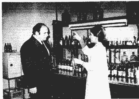
В производственном объединении «Боржоми»

органами он добился пересмотра плана экологически неоправданного строительства трех промышленных объектов. Были пресечены нарушения законодательства об охране природы на нескольких действующих предприятиях.