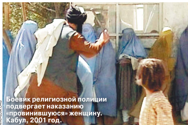
Боевик религиозной полиции подвергает наказанию «провинившуюся» женщину. Кабул, 2001 год.