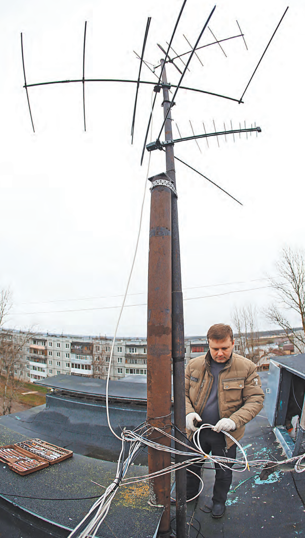
В России проведут ревизию антенн на крышах многоквартирных домов.

ПРАВО В списках невыездных значится 1,7 миллиона граждан