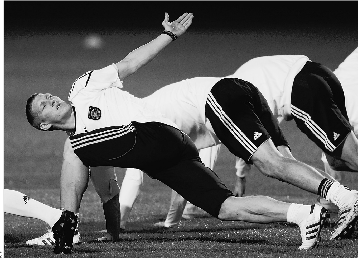
Вчера. Дурбан. Тренировка сборной Германии. Лидер бундестим Бастиян ШВАЙНШТАЙГЕР.

- Полагаю, в первую очередь надо говорить о замечательном достижении всей команды. Не думаю, что стоит кого-то выделять. И все-таки о Швайнштайгере не сказать нельзя: он провел очень сильный сезон в бундесли-