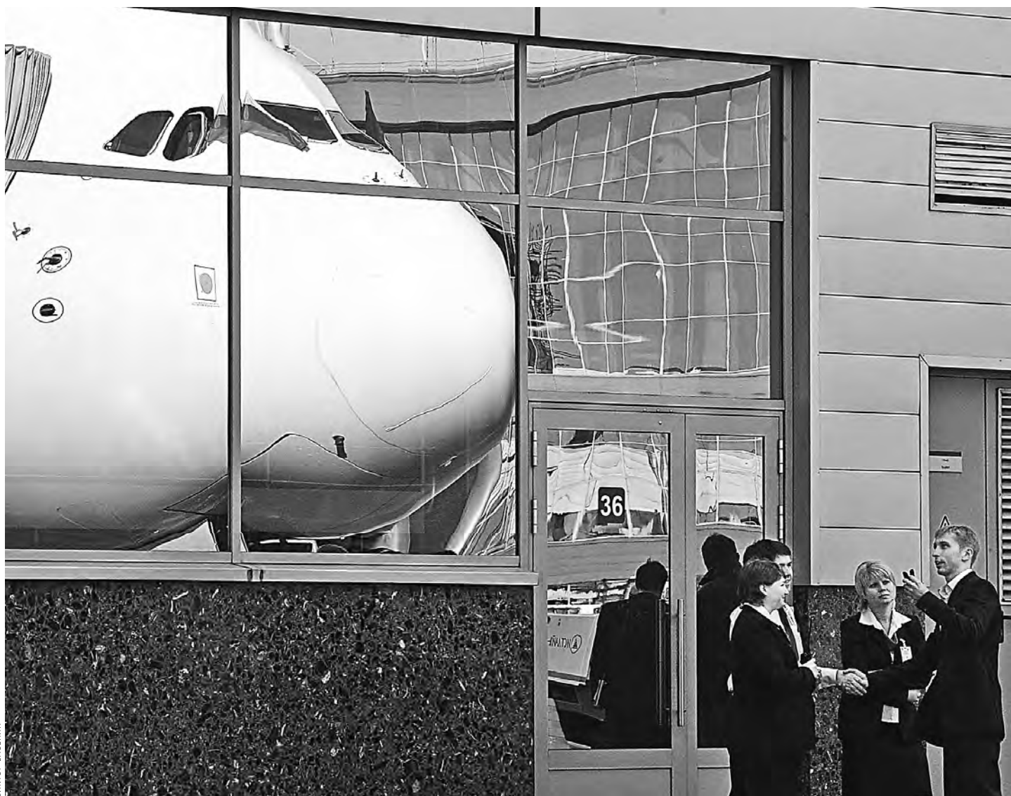
Пассажиры и самолеты могут не опасаться, что тот или иной российский аэропорт закроют из-за того, что он не прошел новую сертификацию.