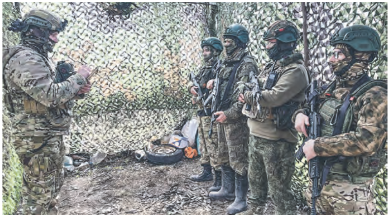
Подготовка к боевой работе расчёта 2С1 «Гвоздика».