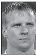
МИНУТЫ СЛАВЫ Вячеслав МАЛАФЕЕВ

Начну с шуток. Меня трансфер Халка удивил, как никого другого. Когда мы уходили в отпуск, бразилец пообещал по возвращении в Петербург купить квартиру через мою компанию. Мы уже успели подыскать ему варианты, а тут новость о переезде Халка в Шанхай!