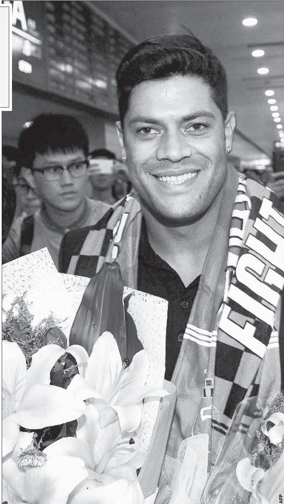
Вчера. Шанхай. Только что ХАЛК прибыл в Китай.