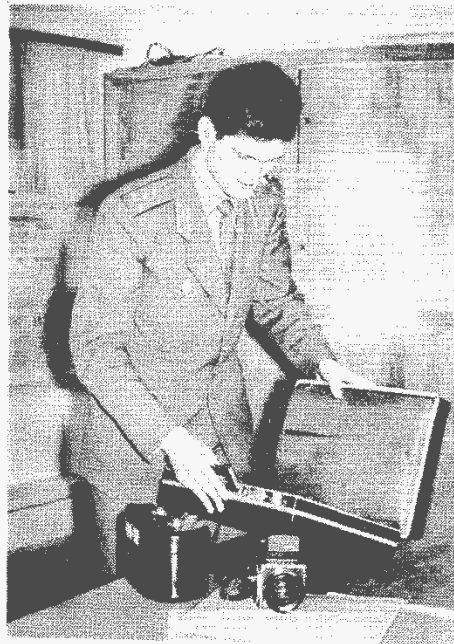
Перед выездом на место происшествия.

Умело применяет средства криминалистической техники, хорошо владеет методикой проведения следственных действий и расследования различных категорий преступлений.