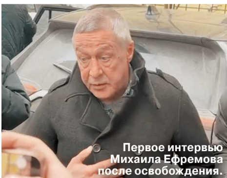
Первое интервью Михаила Ефремова после освобождения.