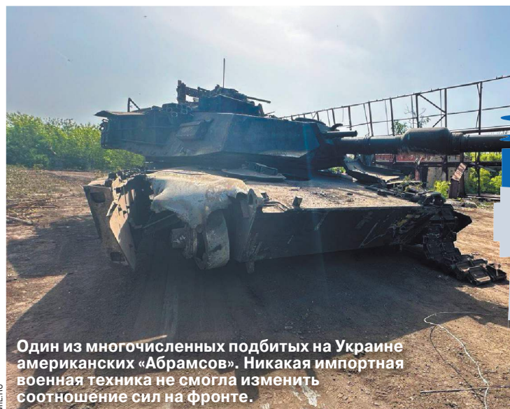
Один из многочисленных подбитых на Украине американских «Абрамсов». Никакая импортная военная техника не смогла изменить соотношение сил на фронте.