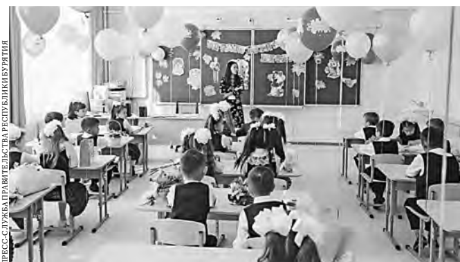
День знаний ученики школы № 40 Улан-Удэ встретили в новом здании.