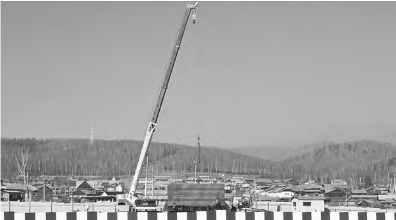
Решением суда строительство завода приостановлено, однако на стройплощадке работают монтажники и техника.

режим болота. Если там еще и дорогу проложат, это приведет к деградации, — уверен орнитолог Виталий Рябцев. 24 марта защитники Байкала и местные жители планируют выйти на организованный митинг в центре Иркутска. Планируется сбор подписей против строительства завода в Култуке.