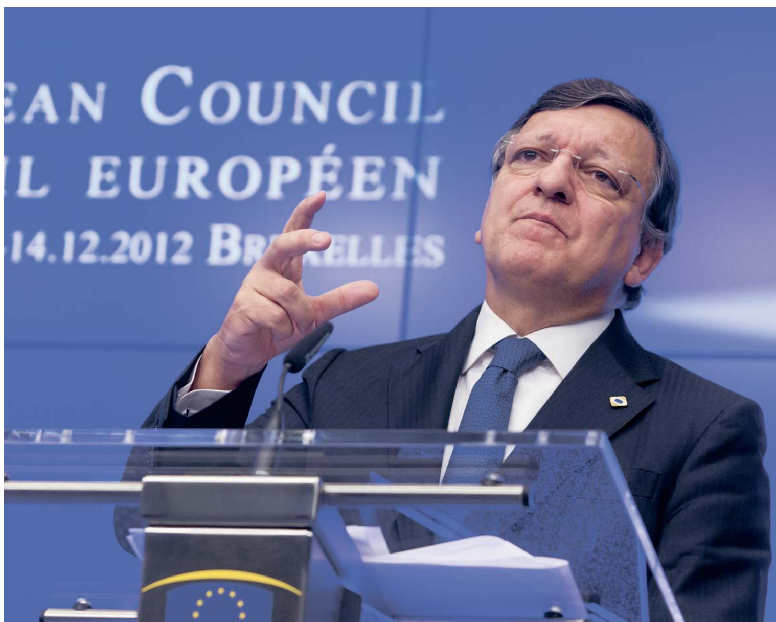
Глава Еврокомиссии Жозе Мануэл Баррозу

В наступившем году Европе предстоит период сложных реформ, которые изменят лицо Старого света