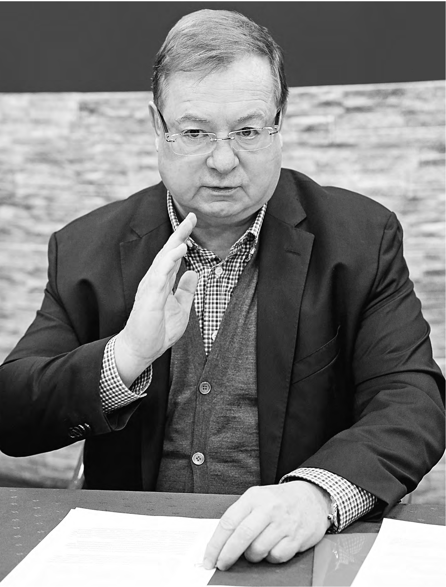
Сергей Степашин: В аварийном жилье люди жить не должны и не могут. Потому что это опасно для жизни.

СЕРГЕЙ СТЕПАШИН: Прежде всего деньги, которые не были освоены, перечисляются обратно в федеральный бюджет. И к такой мере воздействия периодически прибегали. Однако очевидно, что она бьет в первую очередь, не по чиновникам, а по людям. Поэтому «двоечников» мы побуждали готовить новую программу, писать обоснование и докладывать в правительство на уровне вице-премьера. Только после этого решали вопрос: забирать деньги или нет. Санкция, на самом деле, только одна: если человек не способен решить задачу, его надо убирать.