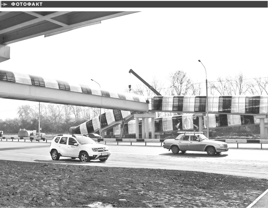
На самой оживленной трассе Красноярского края — федеральной автодороге М-53 — в райцентре Емельяново построили очередной надземный пешеходный переход. На его возведение понадобилось всего полгода — медлить уже было нельзя, за последние три года на этом участке произошло 14 ДТП с участием пешеходов.

В ГОСУДАРСТВЕННЫЕ медицинские учреждения республики к началу осени приняли на работу 102 специалиста с высшим медицинским образованием, причем 69 из них получили дипломы профильных вузов в 2016 году. Большая часть молодых специалистов — 49 человек — вернулись в Хакасию по договорам целевой подготовки, еще 26 докторов удалось «переманить» из других регионов.