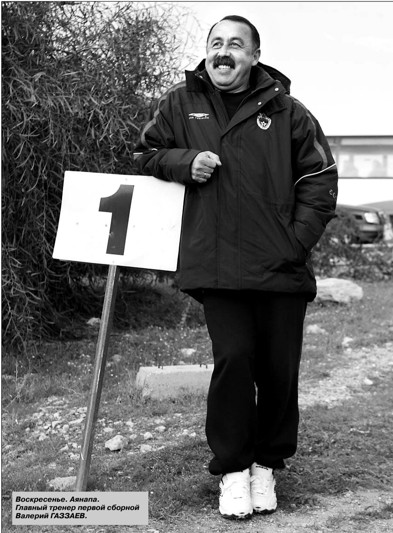
Воскресенье. Аянапа. Главный тренер первой сборной Валерий ГАЗЗАЕВ.

Именно этого мы вправе ждать от сборной России в первую очередь. Даже несмотря на откровенно провальный характер турнира в Лимасоле и на отсутствие Титова с Семаком, и на столь рано пришедшую, но такую долгожданную футбольную весну.