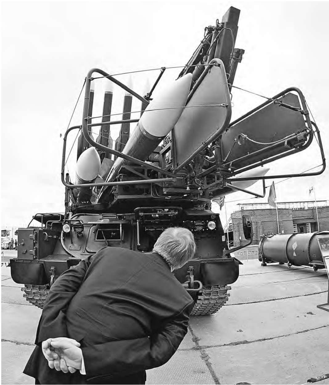
Минобороны присматривается к вооружению, которое пополнит арсенал.

Кроме того, операция в Сирии — это возможность оценить боевую эффективность новых систем вооружения и образцов военной техники. А также подтвердить их тактико-технические и эксплуатационные характеристики, заданные при разработке. В ходе боевой работы нашей группировки специалисты минобороны и представители оборонно-промышленного комплекса проводили оперативный анализ вскрывшихся недостатков и отдельных дефектов вооружений. Они четко классифицированы как конструктивные, производственные и эксплуатационные.