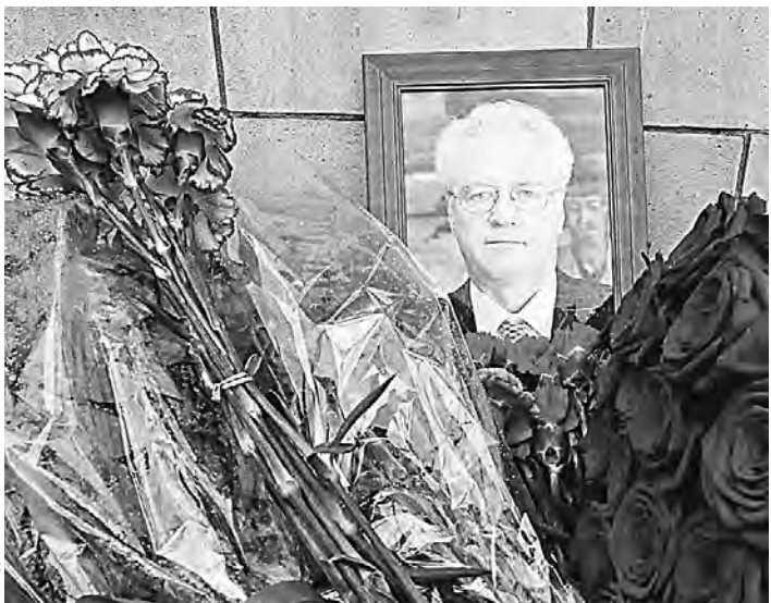
Последние одиннадцать лет Виталий Чуркин входил в элитный круг послов, представляющих в Совбезе страны, стоявшие у истоков ООН.

Мы познакомились еще в конце 80-х, когда он был начальником Управления прессы МИД СССР. Он мастерски проводил