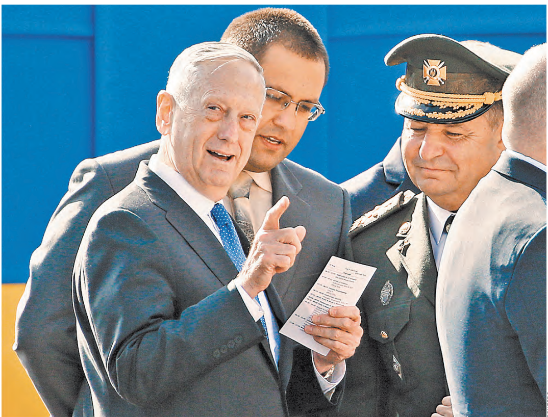
Шеф Пентагона Джеймс Мэттис (в центре) стал главным действующим лицом военного парада в Киеве.