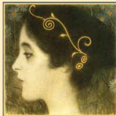
Густав Климт «JUNIUS», фрагмент

Ул. Радищева, 33 Тел.: (343) 379-32-32 uralexpo@uralex.ru www.uralex.ru