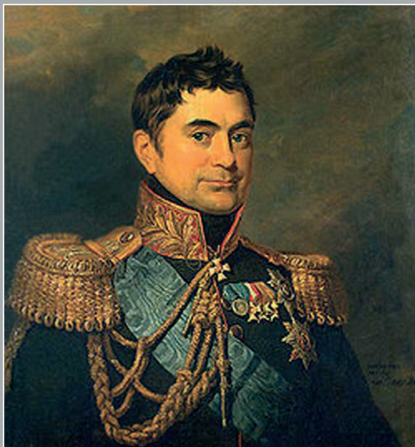
ПЕТР МИХАЙЛОВИЧ ВОЛКОНСКИЙ