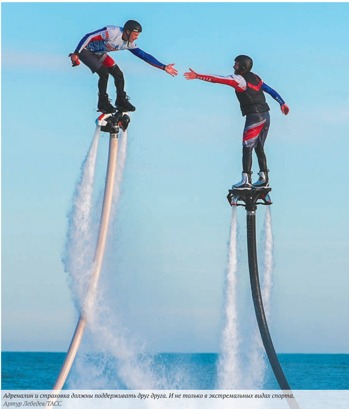
Адреналин и страховка должны поддерживать друг друга. И не только в экстремальных видах спорта.

Объем частного капитала в России к 2021 г. вырастет по сравнению с 2016 г. на 26,6% и составит $1,9 трлн, при этом наибольший темп роста покажут сбережения в наличных и на депозитах, говорится в исследовании международной компании The Boston Consulting Group (BCG) «Мировое богатство 2017: трансформация опыта клиентов».