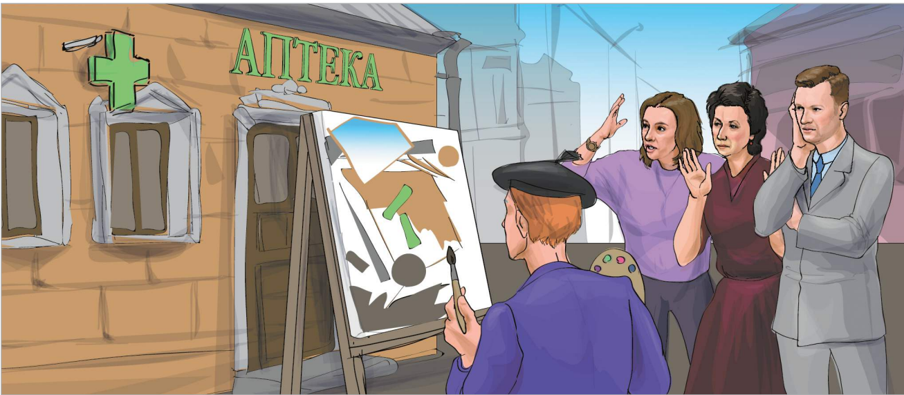
РИС. А. ШЕРБАКОВОЙ

Аптеки испытывают сложности с внесением сведений в федеральные реестры и регистры медицинских организаций и работников. По данным отраслевых ассоциаций, сейчас в единую государственную систему погружено не более 60% фарморганизаций. Ассоциации попросили содействия у Росздравнадзора по снятию технических проблем. Тем более, что внесение и корректность информации об аптеках и их работах может стать новым поводом для проверок и штрафов. Например, необходимо сообщить количество шкафов или такие характеристики зданий аптек, которые неизвестны даже их собственникам. Однако пока розница не спешит искать ответы на вопросы.