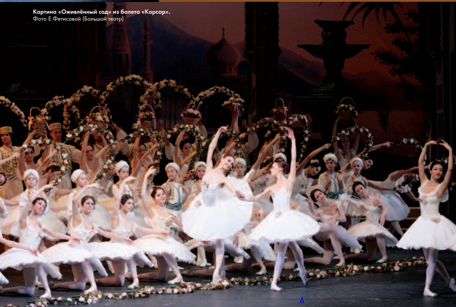
Картина «Оживлённый сад» из балета «Корсар».

Как прощальный реверанс – очаровательная шутка «Марш капельдинерш» и обещание вернуться в ставшие родными стены.