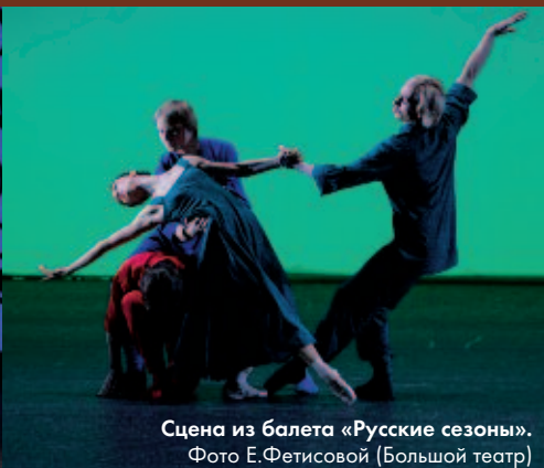
Сцена из балета «Русские сезоны».