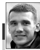
С Андреем ШЕВЧЕНКО НА ЧЕМПИОНАТЕ МИРА

«Мне все равно, против кого играть, потому что на поле всегда выхожу только с одной мыслью - победить. Если надо для этой победы сделать невозможное, сделаю», - говорит голкипер, пропустивший на этом чемпионате мира всего один гол. Мне кажется, что-то похожее говорил когда-то Беккенбауэр, который взял бы Кана в свою команду.