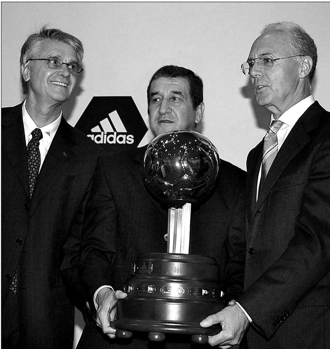
Вчера. Йокогама. Эме ЖАКЕ, Карлос Алберто ПАРРЕЙРА и Франц БЕККЕНБАУЭР (слева направо) - тренеры сборных, выигравших три предыдущих чемпионата мира, - представляют приз лучшему футболисту ЧМ-2002.

Имена лучших футболистов по итогам первенств мира отныне будут наноситься на трофей «Золотой мяч», который учредили ФИФА и фирма Adidas, официальный спонсор ЧМ-2002. Лауреата в день финального матча определяют аккредитованные на чемпионате журналисты.